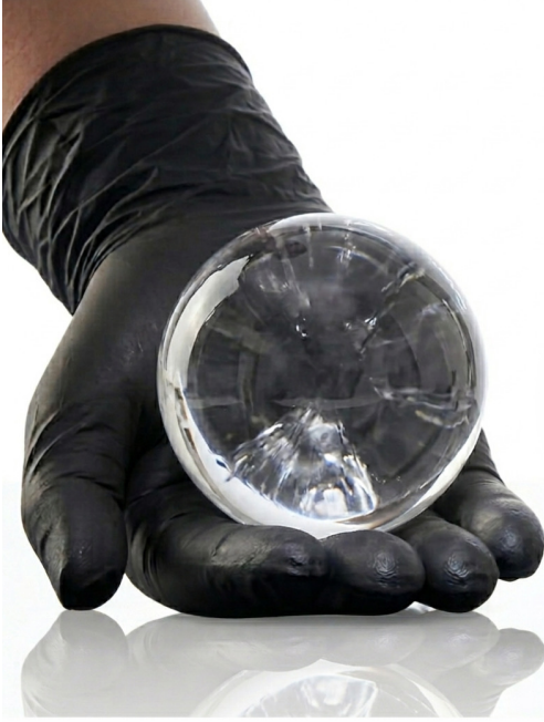
Küre Clear Ice 5,5 Cm ap