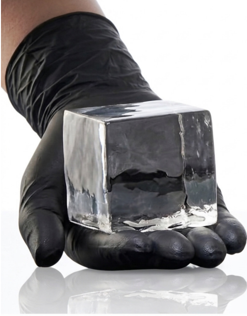
Küp Clear Ice 4,5 x 4,5 x 4,5 Cm Klasik ap